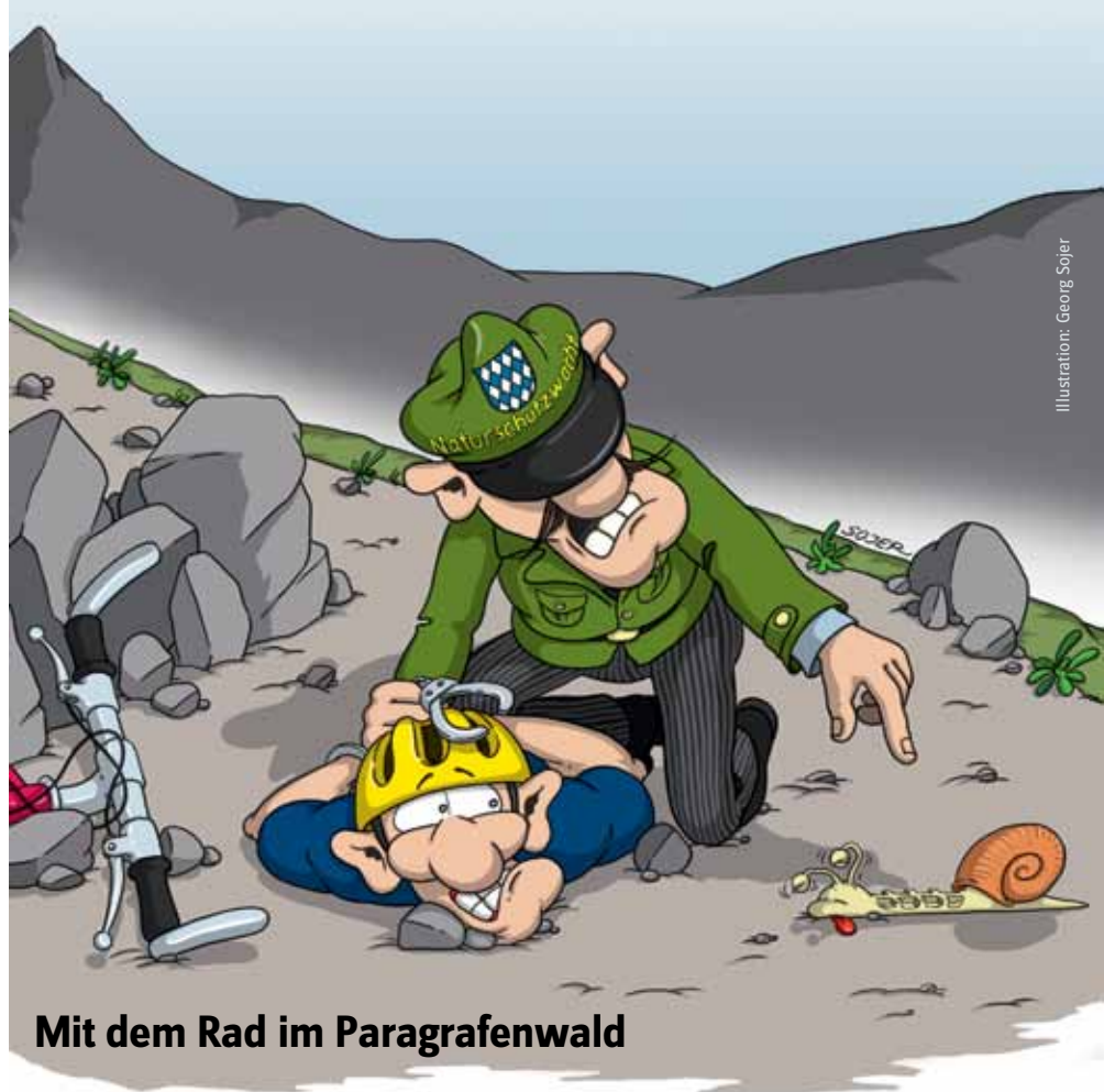
Illustration: Georg Sojer

Österreich: Für das Mountainbiken abseits öffentlicher Straßen und Wege ist die Zustimmung des haftenden Grundeigentümers nötig. Andernfalls